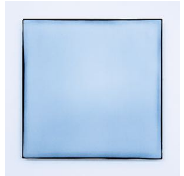
Vestige 2016_10, acrylic on aluminium, 20cm x 20cm